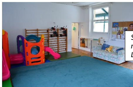
Salle de motricité Lamartine

C'est un lieu de rencontres, de jeu, de partage, de parole, son action concerne la petite enfance et sa parentèle (maman, papa, fratrie, nounous, famille d'accueil,...).