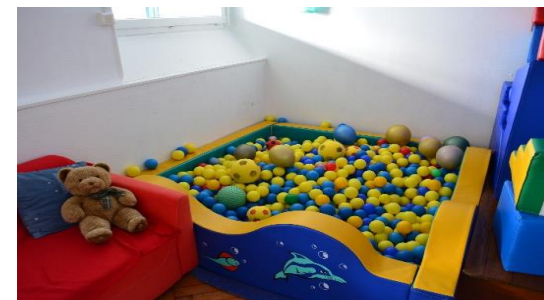
Piscine à balles à Lamartine