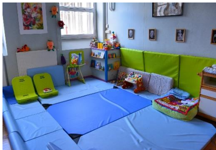
Le «coin» bébé à Lamartine

L'association MAPE Aqua-Rieur a été créée en 1989, à Montluçon.